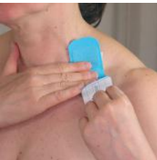
Image 3a. Application d'une bande 6D Tape à deux poignées dans la fosse de la clavicule (fosse supraclaviculaire).

3. Appliquez une bande 6D Tape à deux poignées toujours sur la zone de la clavicule gauche, quel que soit le genou à traiter. Placez la bande de sorte que la clavicule se trouve entre les poignées ou que les deux poignées se trouvent au-dessus de la clavicule, comme illustré dans l'image 3a. Maintenez la tête dans une position normale vers l'avant. Ne tournez pas la tête et n'étirez pas les muscles.